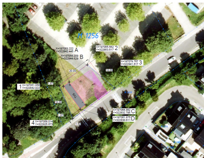
Locatie nieuw TVS

Om netcongestie te voorkomen moet een locatie voor een nieuw te bouwen TVS in dit gebied gezocht worden. In samenwerking tussen de gemeente en Enexis zijn verschillende locaties voor dit TVS besproken. De locatie aan de Schandelermolweg is uiteindelijk het beste alternatief gebleken.