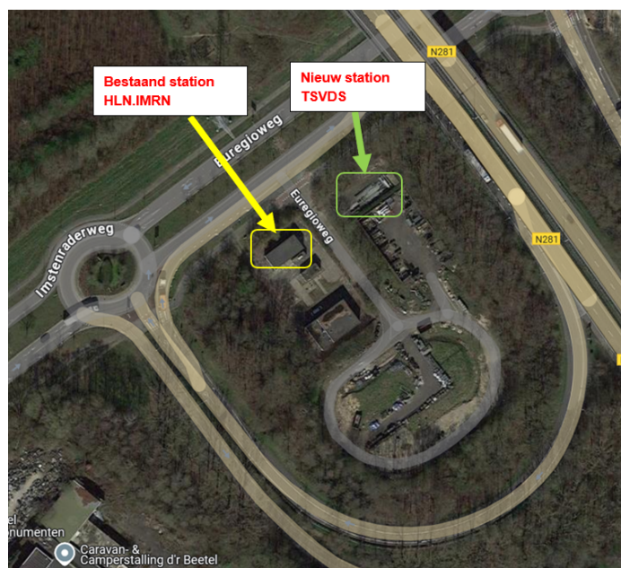
Locatie nieuw TVS.

Het huidige TP-station HLN.IMRN is niet kortsluitvast en dient vervangen te worden. Vervanging van de installatie in het huidige gebouw is niet haalbaar en daarom is gekozen voor nieuwbouw op hetzelfde terrein, naast het huidige gebouw. Het wordt een 10 KV TVS met 21 velden.