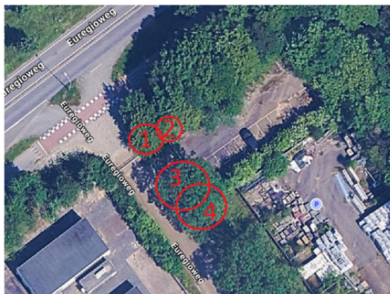
Te kappen bomen volgens inpassingsplan

De Imstenraderweg is een brede ontsluitingsweg. De weg heeft een breed profiel met veel groen. Het groen langs het perceel waar het transportverdeelstation wordt geplaatst, is medebepalend voor het straatbeeld. Volgens het inpassingsplan ligt het kabeltracé binnen de kadastrale grenzen van het perceel. Aan de wegzijde hoeft dan ook geen groen verwijderd te worden. Door de aanwezigheid van deze dichte begroeiing wordt het TVS vanaf de openbare weg grotendeels aan het zicht onttrokken. Er is dan ook geen sprake van onevenredige aantasting van het straatbeeld.