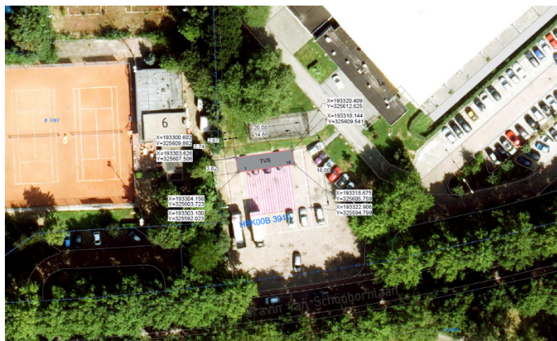
Locatie nieuw TVS

Het huidige TVS in de Nieuwstraat te Hoensbroek moet met urgentie verwijderd worden. De installatie is onderhevig aan diverse faalvormen zoals o.a. roestvorming in de railbak. Dit project is een veiligheidsgedreven werk met prioriteit. Daarom moet een locatie voor een nieuw te bouwen TVS in dit gebied gezocht worden.